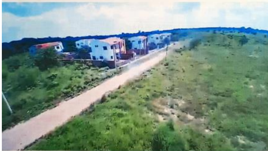
Fotografía hacia el terreno