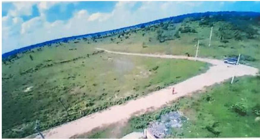
Fotografía hacia el terreno