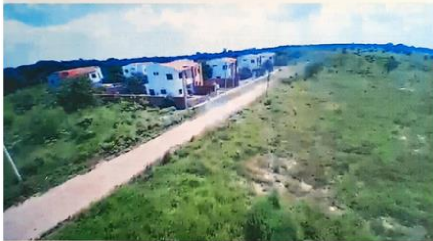
Fotografía hacia el terreno