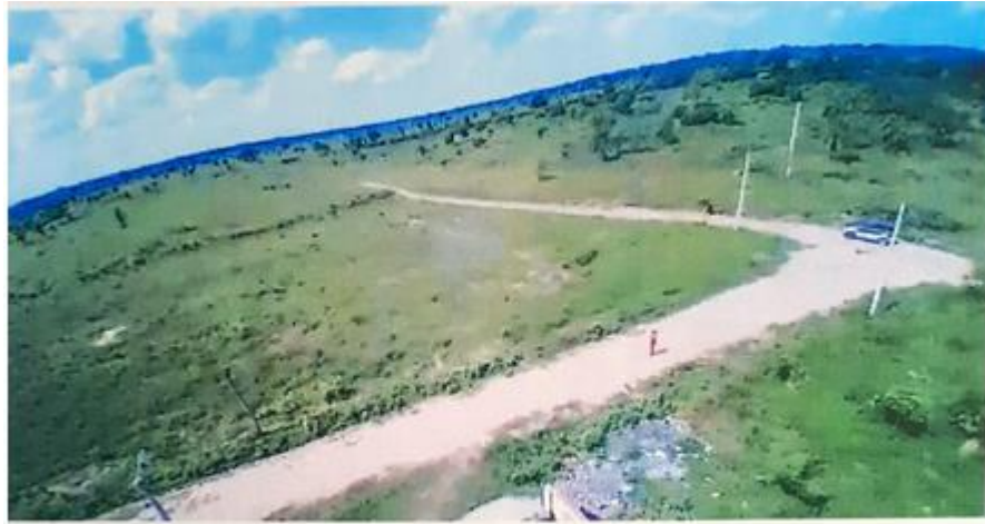
Fotografía hacia el terreno