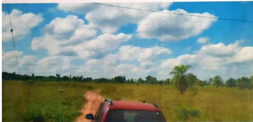
Fotografía hacia el terreno