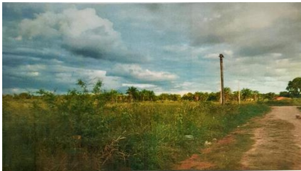
Fotografía hacia el terreno