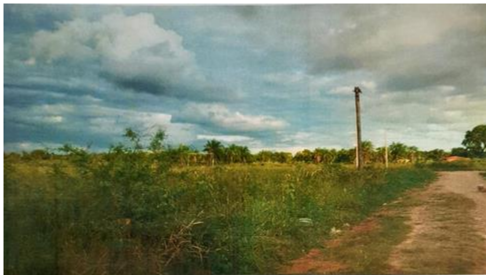
Fotografía hacia el terreno