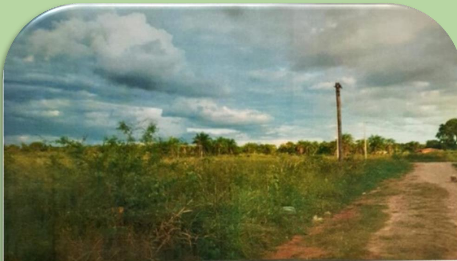
Fotografía hacia el terreno