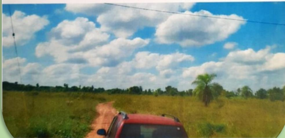
Fotografía hacia el terreno